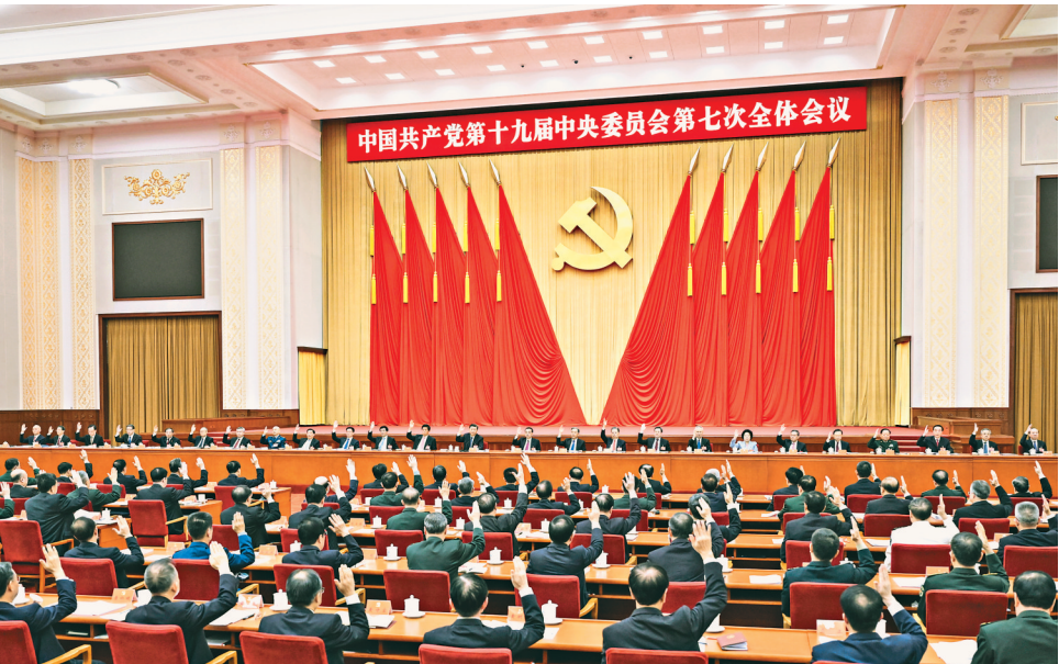
中国共产党第十九届中央委员会第七次全体会议，于2022年10月9日至12日在北京举行。中央政治局主持会议。