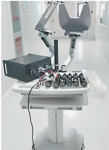
标志灯远场灯成像测试

生活报讯（记者吕晓艳）10月31日15时37分，搭载空间站梦天实验舱的长征五号B遥四运载火箭在我国文昌航天发射场准时点火发射，约8分钟后，梦天实验舱与火箭成功分离并准确进入预定轨道，发射任务取得圆满成功。后续，梦天实验舱将与空间站组合体交会对接完成有关功能测试后，按计划实施转位。记者了解到，中国空间站加速建造，有哈工大的助力！