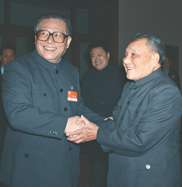
右图:1989年11月6日至9日,中国共产党第十三届中央委员会第五次全体会议在北京召开。这是邓小平同志和江泽民同志亲切握手。