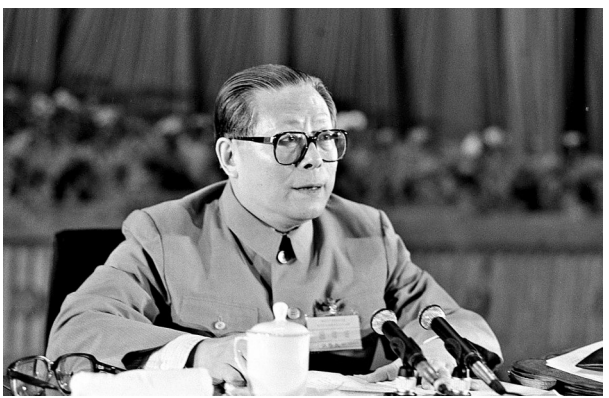
上图:1989年6月23日至24日,中国共产党第十三届中央委员会第四次全体会议在北京召开。这是江泽民同志在会上讲话。