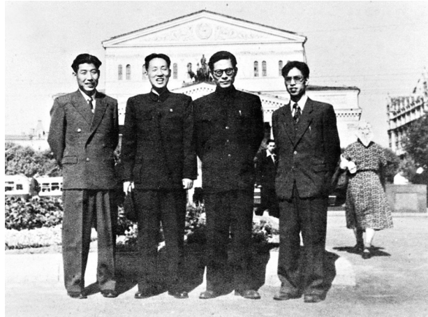
左图:这是1947年江泽民同志在上海交通大学的毕业照。 上图:1955年至1956年,江泽民同志(右二)曾在莫斯科斯大林汽车制造厂实习。这是江泽民等在莫斯科合影。