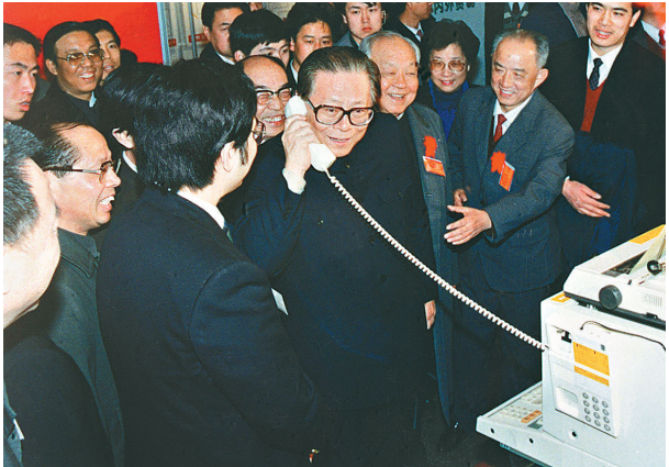
1984年5月,江泽民同志在北京展览馆举行的全国电子产品展览会上,试用国际长途电话向远方的工作人员问候。