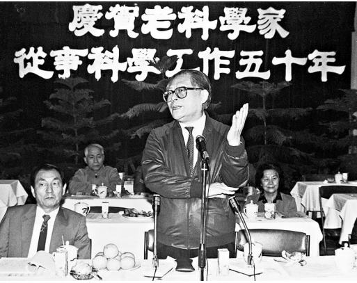
1988年10月,江泽民同志在上海庆贺老科学家从事科学工作五十年座谈会上讲话。