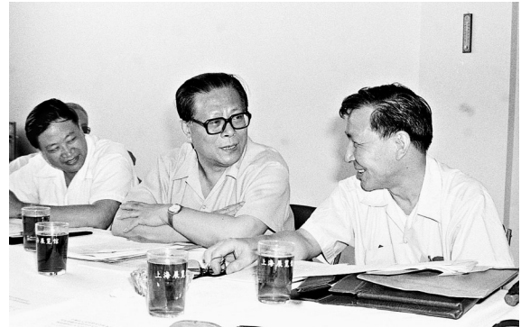
1985年,江泽民同志在上海市八届人大四次会议上。