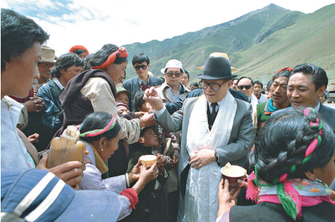
1990年7月25日,江泽民同志与藏族群众共庆望果节。