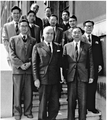
1964年6月,江泽民同志(二排右一)在法国艾克斯莱班出席国际电工委员会会议期间与会代表合影。