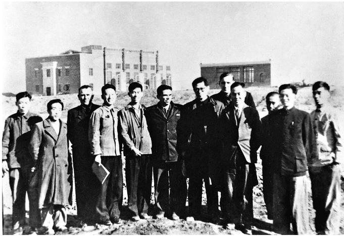
1956年,江泽民同志(左七)在长春第一汽车制造厂同援建一汽的苏联专家等合影。