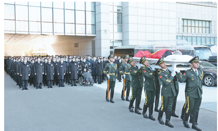
12月5日,江泽民同志的遗体在北京火化。这是习近平、李克强、栗战书、汪洋、李强、赵乐际、王沪宁、韩正、蔡奇、丁薛祥、李希、王岐山、胡锦涛等到中国人民解放军总医院为江泽民同志送别,护送江泽民同志的遗体上灵车。