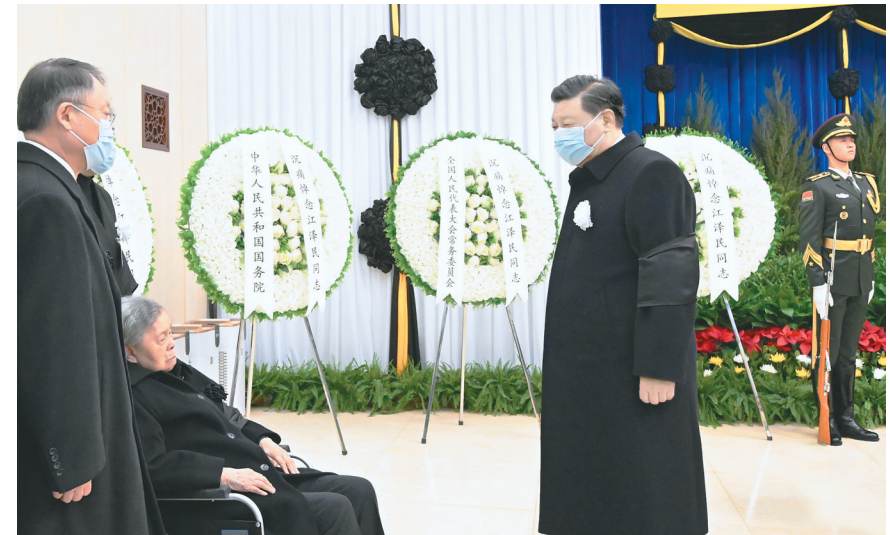
12月5日,江泽民同志的遗体在北京火化。这是习近平向江泽民同志的夫人王冶坪和亲属表示深切慰问。