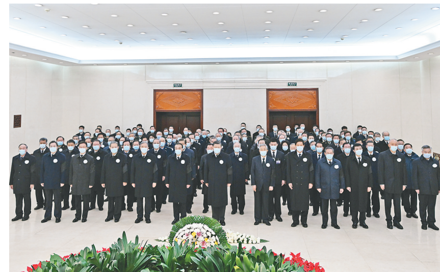
12月5日,江泽民同志的遗体在北京火化。这是习近平、李克强、栗战书、汪洋、李强、赵乐际、王沪宁、韩正、蔡奇、丁薛祥、李希、王岐山、胡锦涛等到中国人民解放军总医院为江泽民同志送别。