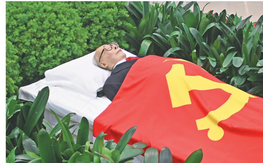
12月5日,江泽民同志的遗体安卧在鲜花翠柏丛中,身上覆盖着鲜红的中国共产党党旗。

从中国人民解放军总医院到八宝山,首都各界群众纷纷来到沿途道路两旁,送别敬爱的江泽民同志,表达对江泽民同志的深切哀思