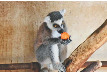
猫冬大队代表二号选手:环尾狐猴 热带来的小猴子在室内感受“家”的温暖,多吃水果,学我补充营养,新一年,身体倍棒!