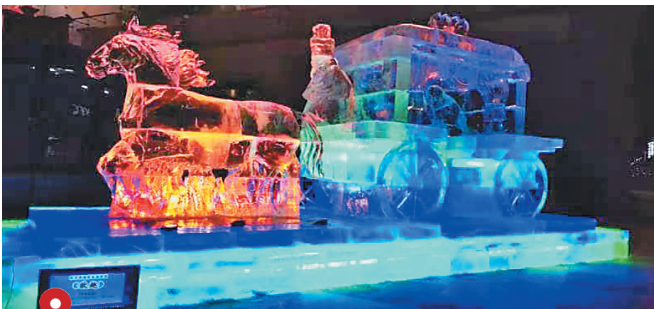
红军街东大直街街口广场冰雪景观《欧趣》