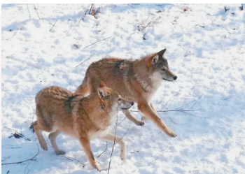
向往自由代表二号选手:灰狼 厚实狼毛是它们的底气,向往自由是我们的天性,加强运动锻炼,祝愿大家新一年强身健体,吃嘛嘛香!