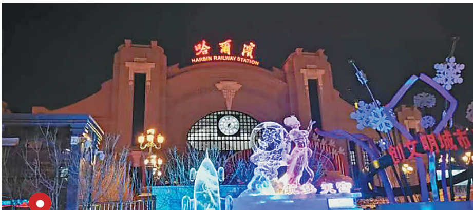
哈站北广场冰雪景观《筑梦天宫》

周边建筑风格及灯饰亮化有机结合,规划“打造七大都市、展示城市风情”等三大系列主题景观,突出展示哈尔滨独特的城市文脉、欧陆风情和冰雪特色,让市民和游客近距离欣赏冰雪艺术,感受冰雪文化。日前,街路冰雪景观全部落成。