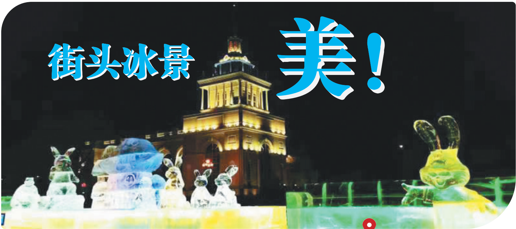
人民广场冰雪景观《兔兔赛跑》

生活报讯 (蒋菲 记者栾德谦/文) 冬天,哈尔滨拥有童话般的冰雪季节,这里不仅有冰雪大世界、太阳岛雪博会,还有街头匠心打造的冰雪景观。冰城人用冰雕雪塑的灵动,表达着这座城市独有的诗意浪漫与热情奔放。1日,很多市民游