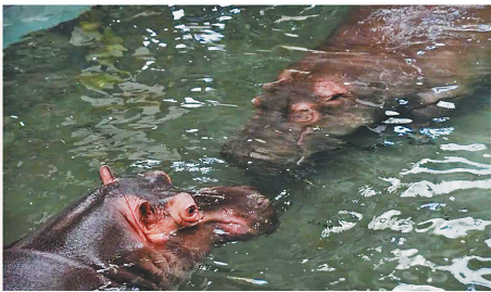
猫冬大队代表一号选手:河马 温泉里面泡一泡,什么烦恼都忘掉,学学我游泳健身,新一年健健康康。

生活报讯 (记者李丹) 新年伊始,随着气温持续走低,北方森林动物园的小动物们不同于我们采用地热、暖气、加热毯等取暖方式过冬,它们有着自己独特的过冬选择。有不畏寒冷向往自由在室外撒欢的,也有喜欢在温暖的室内猫冬的,还有喜欢在水里享受温泉的,新的一年,小动物们也送来祝福,祝愿大家安康快乐!