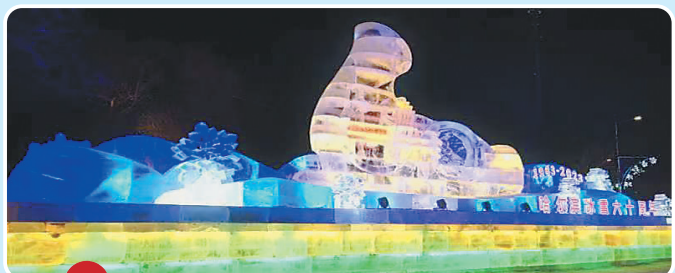
太阳岛道口冰雪景观《冰雪文化之都—魅力哈尔滨》