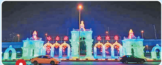
机场路零公里环岛冰雪景观《冰城》