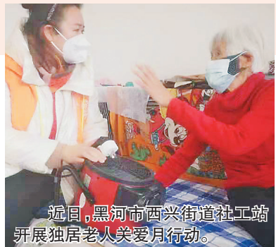
近日,黑河市西兴街道社工站开展独居老人关爱行动。

此外,为了树立身边看得见摸得着的可学典型,黑龙江省组织开展了2022年“龙江社工”“蒲公英”风采推介展示”活动。经各社工站申报、各市(地)民政局审核把关、省内外专家评审及社会公示等程序,向社会公众推介“蒲公英”品牌社工站14家、“蒲公英”最美驻站社工10名、“蒲公英”社工服务示范案例20个、最感人“蒲公英”社工故事20个、创意“蒲公英”社工宣传标语20条和最佳“蒲公英”社工站通讯员10人。一系列的利好政策,也促使龙江社工持续升温。