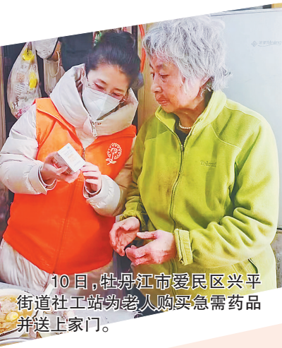
10日,牡丹江市爱民区兴平街道社工站为老人购买急需药品并送上家门。

据悉,省民政厅创新考前培训方式,联合民政部直接组织社工职业资格考前培训2800多人,报名人数连续两年以40%速度增长。2022年,黑龙江省报考参加职业资格考生人数9733人,通过国家社会工作职业资格考试2271人,通过率创历史新高,目前,全省持证社会工作者11961人。