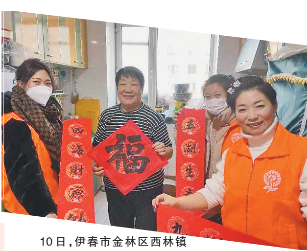
10日,伊春市金林区西林镇社工站为困境家庭送去福字。