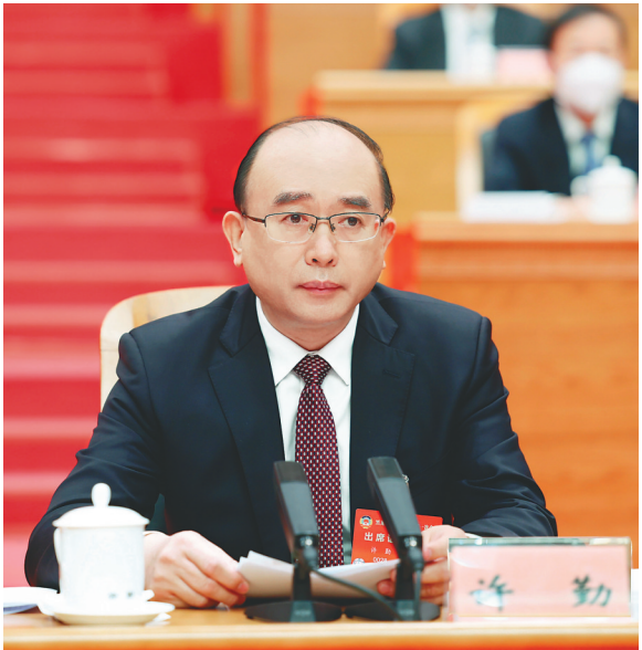
省委书记许勤讲话。