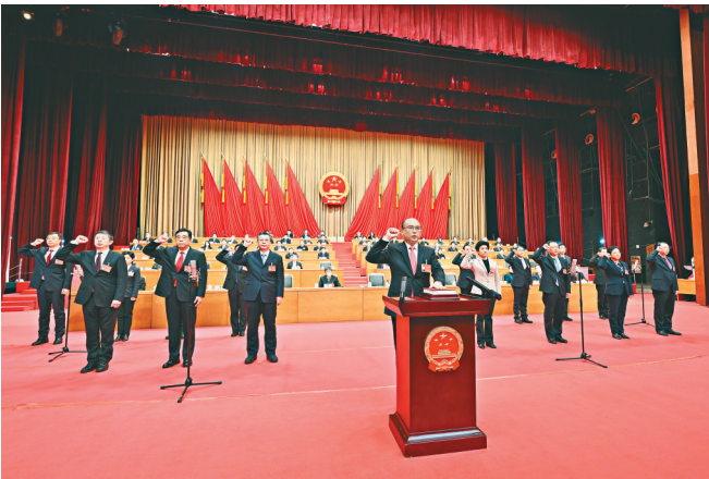
会议举行宪法宣誓仪式，许勤领誓。