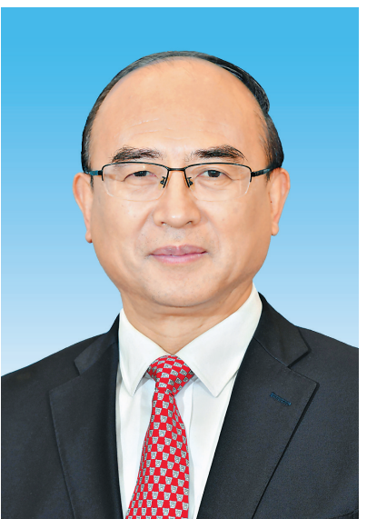
省人大常委会主任许勤

会议举行宪法宣誓仪式，许勤领誓。 宪法宣誓后，许勤作了讲话。他指出，黑龙江省第十四届人民代表大会第一次会议，在全体代表和与会同志的共同努力下，圆满完成了各项议程。会议期间，全体代表牢记使命、依法履职、积极建言，充分体现了饱满的政治热情和强烈的责任担当，彰显了新时代龙江人大代表的风采。这次会议开得很成功，是一次高举旗帜、团结奋斗、继往开来的大会，统一思想、凝聚力量、共谋发展的大会，坚