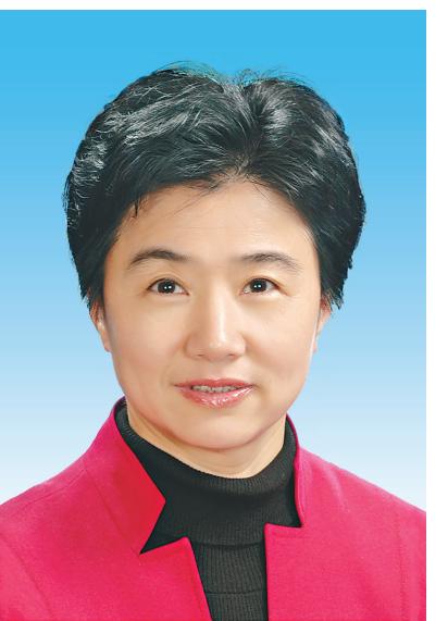
省人民政府省长梁惠玲

定信心、提振士气、鼓舞干劲的大会，对于动员全省人民深入学习贯彻习近平总书记重要讲话重要指示和党的二十大精神，加快推动龙江振兴发展和现代化强省建设，具有十分重要的意义。 许勤表示，这次大会选举我担任省人大常委会主任，我深感使命光荣、责任重大。我将和当选的其他同