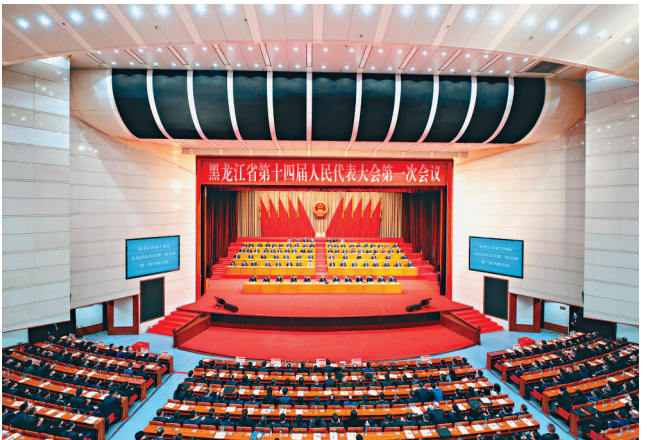
闭幕会现场。