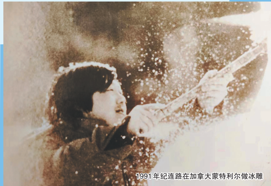
1991年纪连路在加拿大蒙特利尔做冰雕