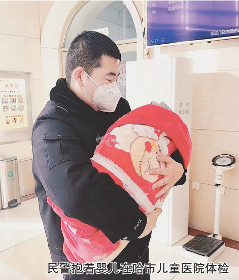
民警抱着弃婴在哈尔滨市儿童医院体检

生活报讯(记者黄迎峰)8日6时许,哈尔滨市公安局道里分局丽江路派出所接到辖区居民报警称,在群力丁香公园东南角附近