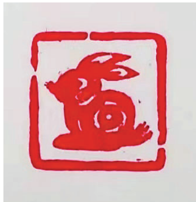
篆刻《红兔迎春》申士忠 作