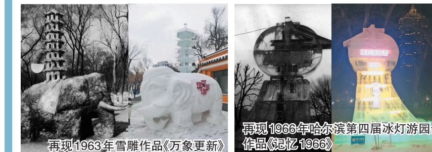
再现1963年雪雕作品《万象更新》

“快给拍个照,我跟这个1963年的‘老冰灯’同龄。”“太惊喜了,这个《龟兔赛跑》是我13岁时看到的,时隔41年竟然又在这里重现啦!”……游客们对于这个“景观设置”连连叫好。一位女士带着8岁的儿子来打卡,她说,冰雕是哈尔滨本土文化的代表,听说这里可以看到“老冰灯”,她专程带孩子来看,想让孩子通过这些再现的经典作品了解哈尔滨的历史,了解为啥哈尔滨叫冰城。