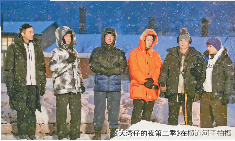
《大湾区的夜第二季》在横道河子拍摄

演出地点:哈尔滨音乐厅(群力大道1号) 业务电话:0451-84692455 售票电话:0451-84699400 关注最新演出资讯,请加入我们的官方公众微信:yjt0451