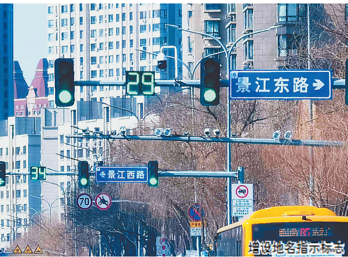
增设地名指示标志

交警部门先后在和兴路、松北大道等5条道路,增加中心隔离绿网6800余米,近期还将在埃德蒙顿路、城乡路等道路上继续增设中心隔离绿网,用物防设施阻断行人随意乱穿马路,引导行人通过天桥过街。