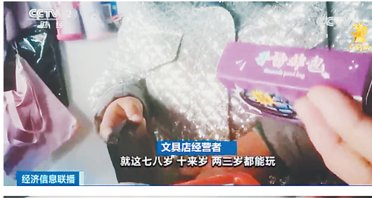
经济信息联播 一踩就“炸”臭气熏人 危险的“炸包”流向校园周边