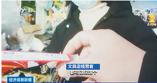
经济信息联播 文具店经营者 就这七八岁、十来岁、两三岁都能玩