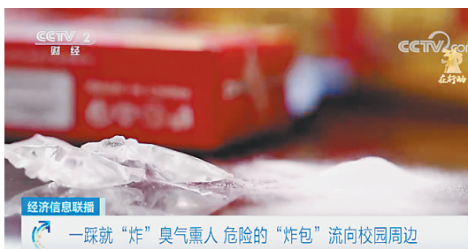
经济信息联播 一踩就“炸”臭气熏人 危险的“炸包”流向校园周边