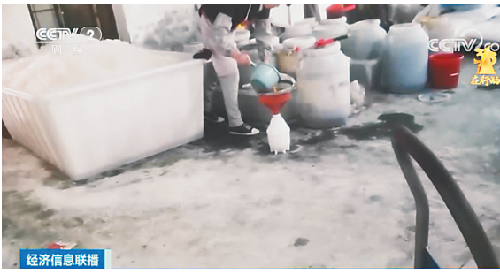
经济信息联播 一踩就“炸”臭气熏人 危险的“炸包”流向校园周边