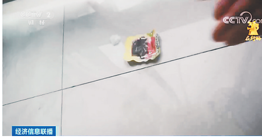
经济信息联播 一踩就“炸”臭气熏人 危险的“炸包”流向校园周边