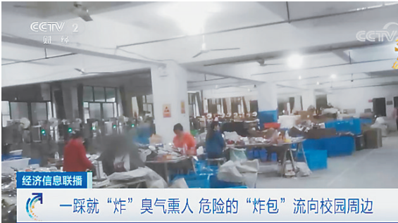
经济信息联播 一踩就“炸”臭气熏人 危险的“炸包”流向校园周边