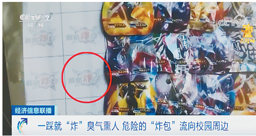
经济信息联播 一踩就“炸”臭气熏人 危险的“炸包”流向校园周边