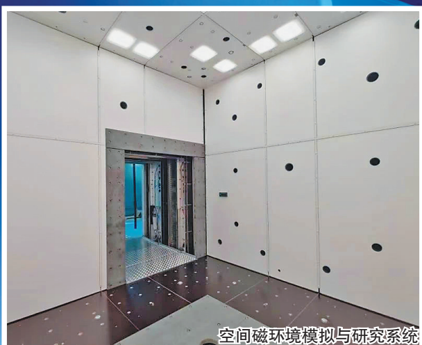
空间磁环境模拟与研究系统