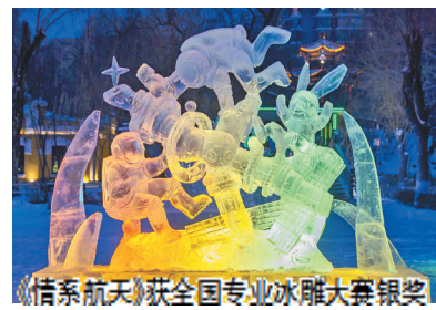
《情系航天》获全国专业冰雕大赛银奖