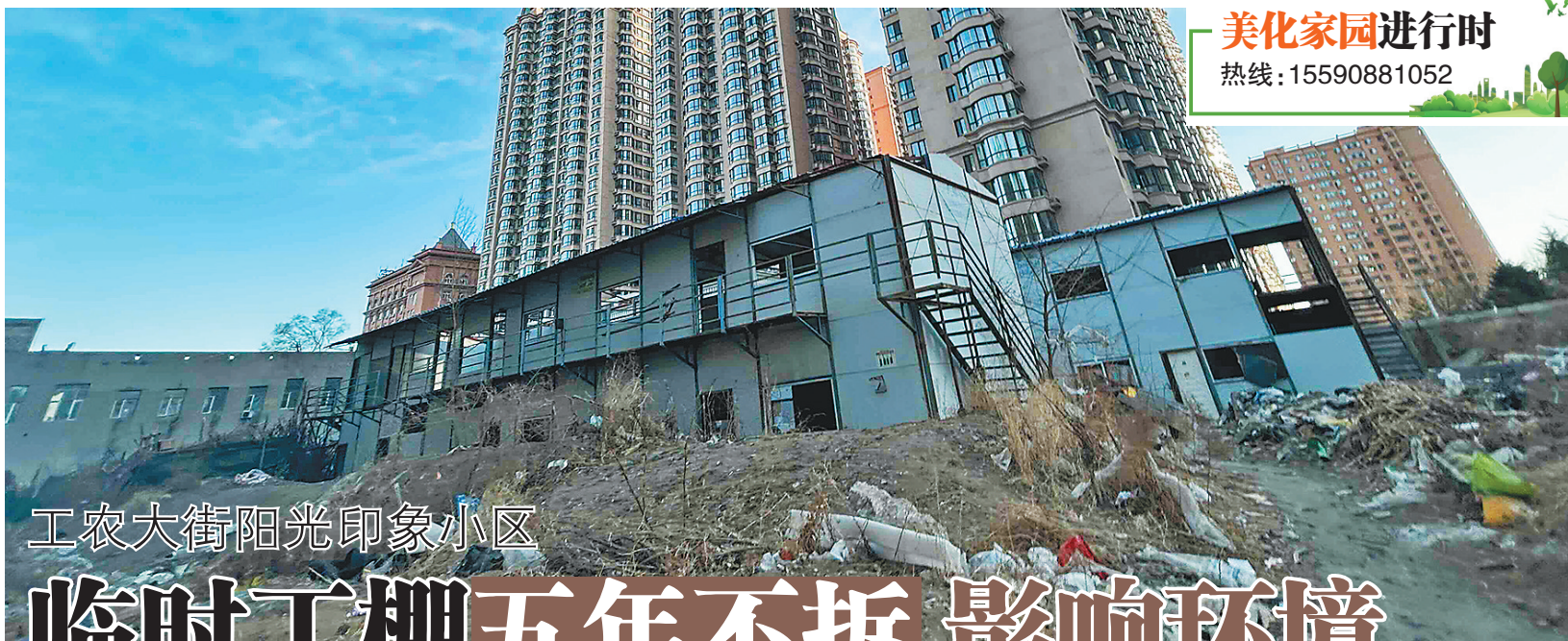
工农大街阳光印象小区