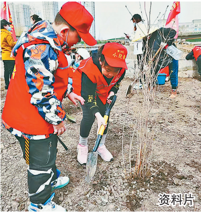
资料片 新闻·生活报 慈善

生活报讯 (记者李丹) 4月22日13时30分,生活报2023年公益春植大幕拉起,生活报将牵手哈尔滨市香坊区园林管理局,在哈尔滨市香坊区指定区域,与200名读者一起,亲手栽种下200株丁香树!提醒报名成功志愿者,请准时参与,提前规划好路线,避免迟到! 本次活动中,未成年人及老年人须有监护人陪同参与,参与者请自备遮阳帽、手套等物品,女士尽量穿平底鞋或运动鞋参与活动。植树工具及水桶自备,活动现场请听从工作人员指挥。 据哈尔滨市香坊区园林管理局专业人士介绍,为保证树木的成活率,工作人员准备了适合树木生长的黑土,陆续确定树木栽植点位并挖坑,在地面上已浅挖小坑标记了栽种位置,参与活动的市民可按照点位进行种植。 由于本次植树活动人员众多,希望市民有序集合,听工作人员讲解完植树步骤及注意事项后,再按要求进行植树,具体流程如下:人员集合→排队到植树地点→讲解植树方法及注意事项→挖坑→领树苗→植树→浇水→封土→系上心愿卡→自由活动(拍照留念)→解散。 本次活动栽种地点在拥军街与黎明大道交口,距离市区近、交通便利,便于植树人员随时回来看一看自己亲手植下的树苗长势如何。活动后,还可写下小树祝福卡,祝福小树苗茁壮成长。