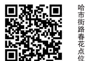
哈市街路春花点位