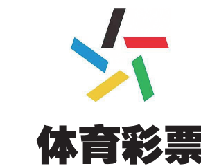
黑龙江省体育彩票管理中心协办