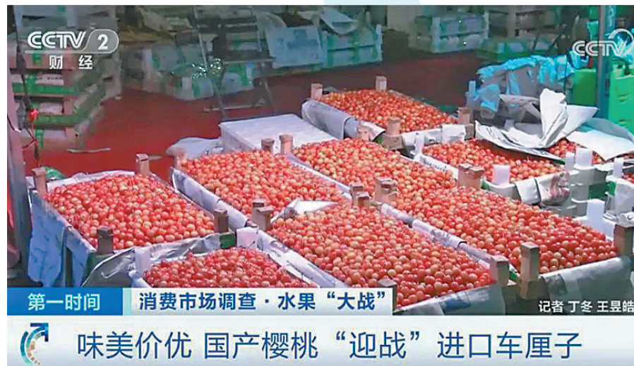
第一时间 消费市场调查·水果“大战”