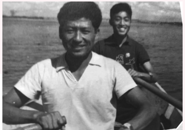
风华正茂的二姨夫(前排白色短袖)泛舟松花江上

在我小学二三年级的时候,您自己从医院辞职开了诊所,原来家里的平房成了病房,挤满了孕妇和家属,您一个人背负着这些家庭未来的希望,把他们的孩子迎接到了这个世界,而您自己的脸上却总是很疲惫,生活作息也极不规律。那时东北的天气每到春秋换季,我都会病一场,就会去诊所边打针边写作业,也看着您对患者家属讲解病情。记得您的患者很多都是