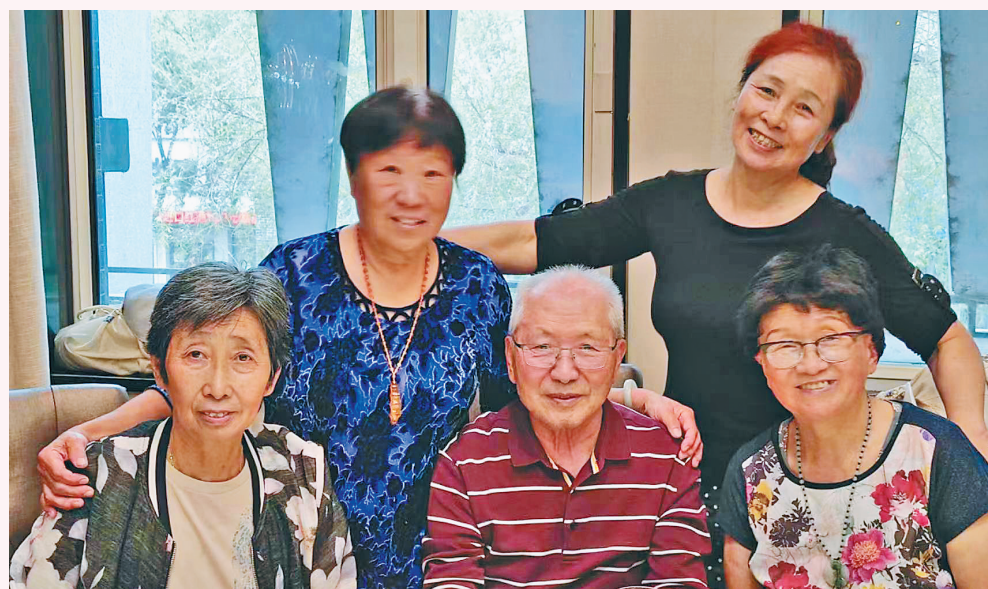
2018年夏天,二姨夫妇(前排左一左二)和我们最后一次聚会