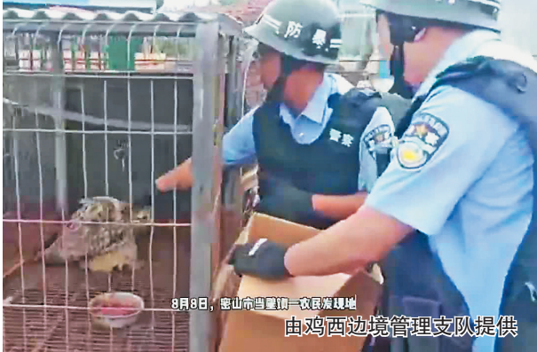
8月8日,密山市当壁镇一农民在自家农田劳作时,发现地头趴着一只猫头鹰,由鸡西边境管理支队提供

“全家都急坏了,多亏了警察同志。”看着孩子平安归来,孩子家长对民警的暖心帮助表示感谢。临别前,民警嘱咐家长一定要加强与孩子的沟通交流,避免类似事件再次发生。