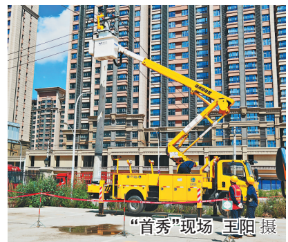
“首秀”现场

据悉,“首秀”的配网带电作业机器人集成了智能感知、图像识别等先进技术,通过机械臂工具实现对导线进行剥皮、安装接地环、断、接引线等复杂动作,