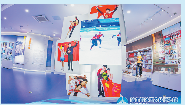
哈尔滨冰雪文化博物馆

冰雪大师工作室是哈尔滨冰雪发展的不竭源泉,为哈尔滨拥有冰雪领域话语权发声,为促进冰雪事业发展奠基。