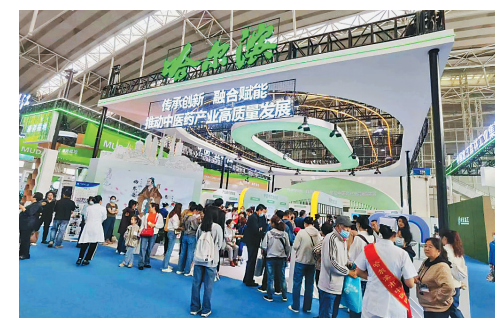
本届博览会着力打造线上展览平台,开展“云展览”“云对接”“云洽谈”“云展览”共设置全省中医药发展成果及重大项目虚拟展厅、中医药规上及重点

中医药健康产品展区、中医药科研院所(所)及研究成果展区七大板块。同期举办第三届黑龙江中医药大健康产业发展论坛、2023名中医论坛、第二届黑龙江民间中医药粹挖掘发展论坛、第四届黑龙江中药材种植与产业发展论坛、黑龙江省中药产业发展论坛5场高水平论坛。