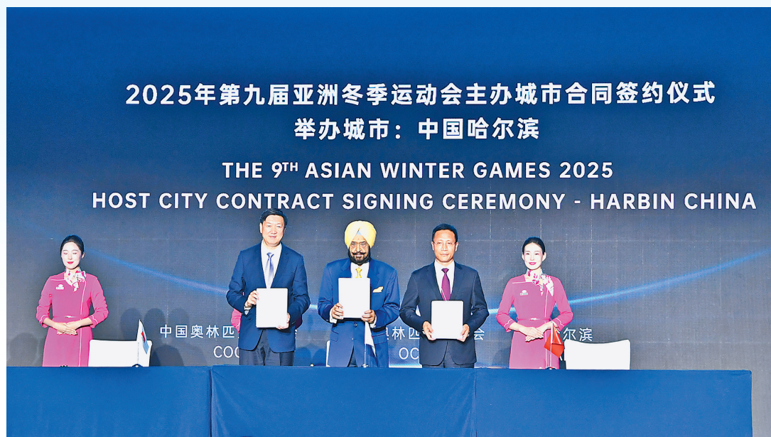
成功举办1996年第三届亚冬会、2009年第二十四届世界大学生冬季运动会等冬季综合性运动会和众多国际单项赛事,培养了一大批冰壶、冰球、滑

哈尔滨冰雪资源得天独厚、冰雪文化魅力独特、冰雪品牌声名远扬,“哈尔滨国际冰雪节”是世界四大冰雪节之一。作为中国冰雪运动的摇篮和全国冬季体育项目的“领头羊”,哈尔滨拥有大型群众冰雪运动“百万青少年上冰雪”活动品牌,市内冰雪运动场馆设施完善,具备丰富办赛经验,曾