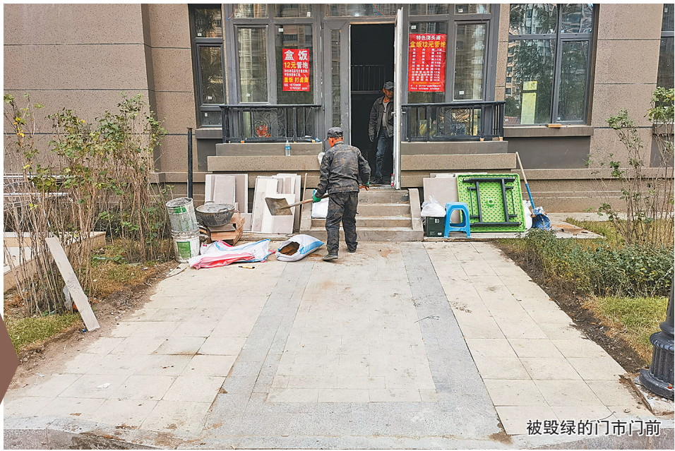
被毁绿的门市门前