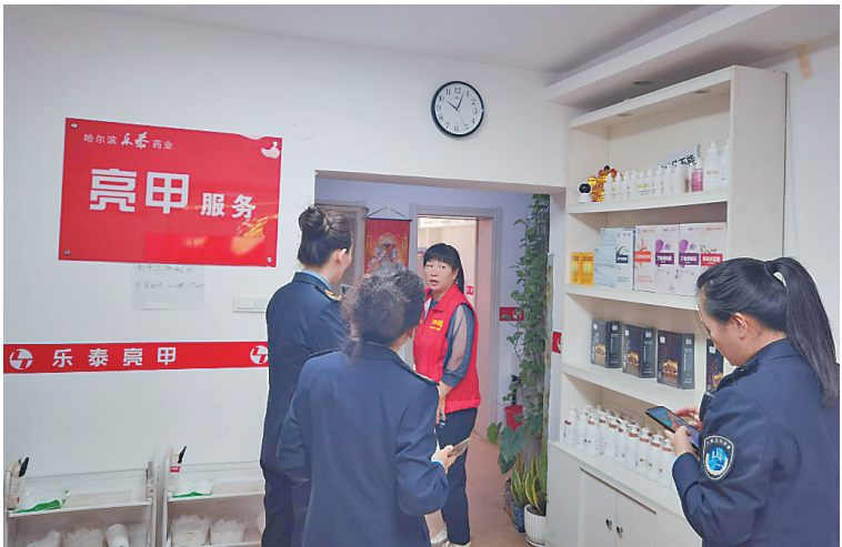
卫生监督所执法人员现场检查