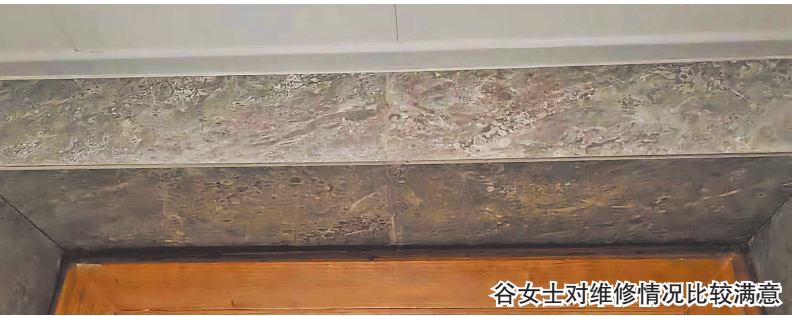
谷女士对维修情况比较满意

完事儿，让我自己有啥招儿使啥招儿。”谷女士的丈夫表示，因为没有同意对方提出的要求，目前华润悦府的人一直没有联系他。谷女士及其丈夫担心，现在虽然对出现的问题维修了，