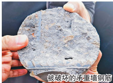
被破坏的承重墙钢筋