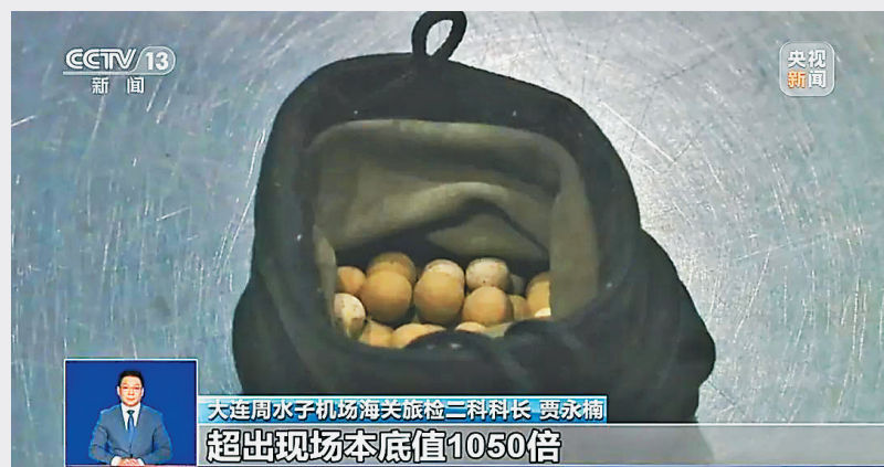
海关多次发现旅客携带物品辐射超标

海关关员介绍,钷-232作为放射性物质,已被世界卫生组织国际癌症研究机构列为1类致癌物,长期接触会导致脱发、呕吐、流鼻血,严重者或引发恶性肿瘤。根据国际原子能机构规定,普通公众辐射暴露的安全限度为每年1毫西弗。