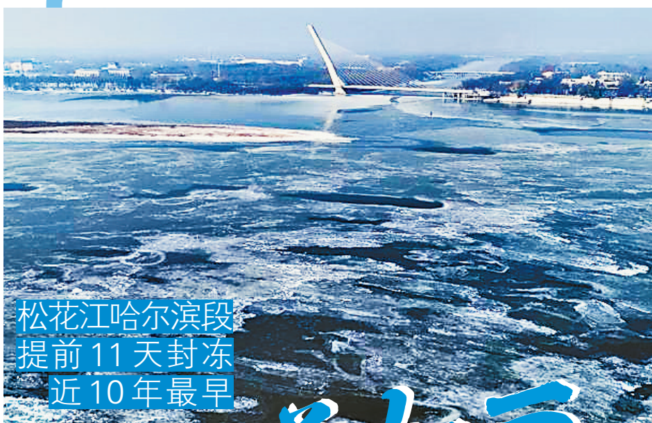
松花江哈尔滨段提前11天封冻 近10年最早