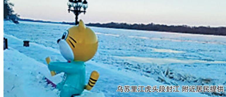
乌苏里江虎头段封江

生活报讯(实习生周思彤 记者栾德谦)28日,生活报记者从省水文水资源中心获悉,我省四大江河陆续封江,黑龙江抚远段、乌苏里江虎头段、松花江依兰段、嫩江齐齐哈尔段、呼玛河封冻。至此,嫩江干流已全部封冻。