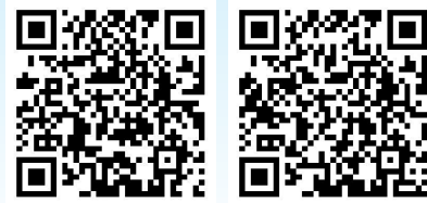
获奖单位名称 获奖学校名单

目前,评选名单已经出炉,50家单位和10所中小学学校获得“消防安全知识问答”先进单位称号。10个学校里面,每个学校选取成绩优秀的10名学生,共计100名学生获得“火焰蓝小卫士”称号。两个称号均会颁发奖状,届时由哈尔滨市消防救援支队与生活报社联合颁奖,颁奖时间另行通知。