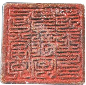
「勾当公事龙字号之印」在阿城出土的金代官印