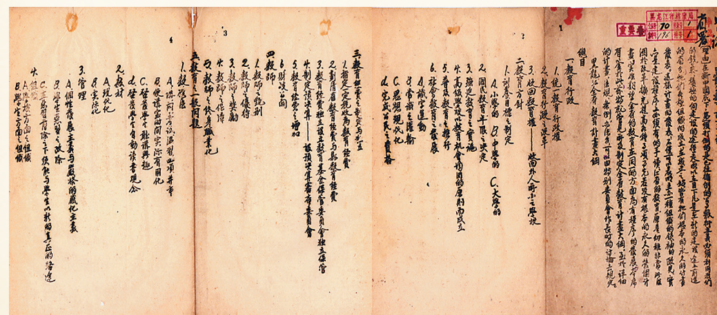
《黑龙江教育计划大纲》