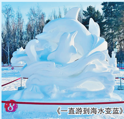
《一直游到海水变蓝》