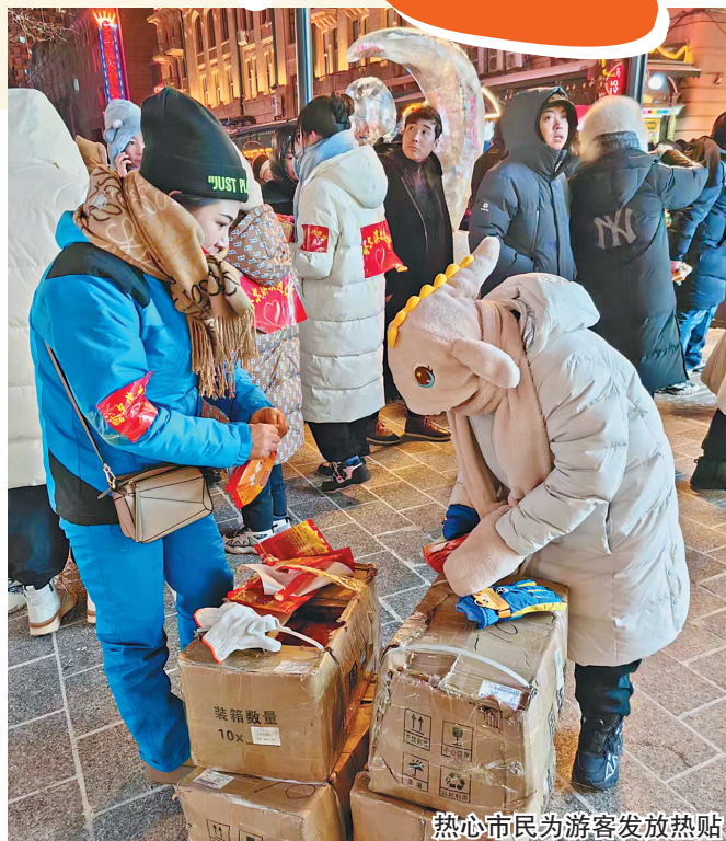
热心市民为游客发放热贴