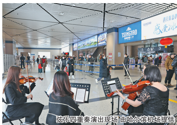
弦乐四重奏演出现场

“没有最好,只有更好。”随着冰雪节启幕,哈市启动文明服务品质提升专项行动,拉满旅游服务细节,让远道而来的游客看到的是冰,感受的是热。