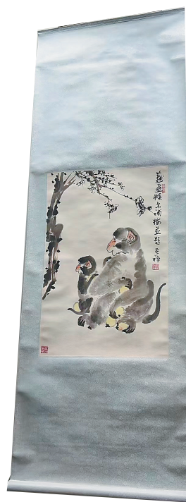
李苦禅、李燕《梅猴图轴》

展览中,常引人驻足的还有徐悲鸿、李苦禅、黄胄的作品。徐悲鸿的一幅《飞马图》,背后的故事总是让观者听得入神。此作是徐悲鸿送给谢冀鑑堂的,并罕见地提上款。1959年,藏家托友人请吴作人鉴赏,吴先生鉴赏后深感此作是徐悲鸿精品,在作品上题字“神妙独数”,1964年被省博物馆征集为馆藏。此画不仅有徐悲鸿题字,还有吴作人的评价,极为珍贵。