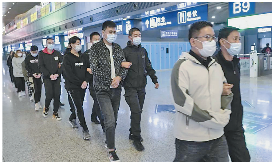
2022年,办案人员将犯罪嫌疑人押解回兰州。

据新华社报道 有明星主演,预计票房在7亿元,投资120万元收益可达400万元……听上去如此诱人的电影投资项目,其实是个骗局,全国3000多人上当,涉案金额6.5亿元。兰州警方近日公开征集一起影视投资类诈骗案件线索,涉及4家公司及12部电影。这种新型诈骗隐蔽性很强,很多受害人被骗后依然蒙在鼓里。记者就此进行了调查,揭开骗局真相。