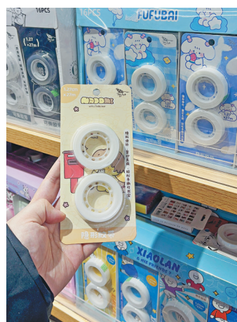
开学在即 文具热销