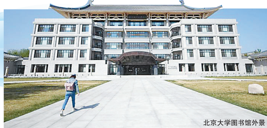
北京大学图书馆外景

高校图书馆是大学生获取和更新知识的重要阵地。记者在各地走访时看到，针对当前大学生阅读率走低、图书馆空间资源紧张等问题，一些高校图书馆着力改造升级、优化服务，更好满足读者多元化需求，推动更多学生“爱读书”“善读书”。业内专家认为，在数字化浪潮、建设“未来学习中心”的背景下，高校图书馆的转型升级还在路上，未来发展空间广阔。