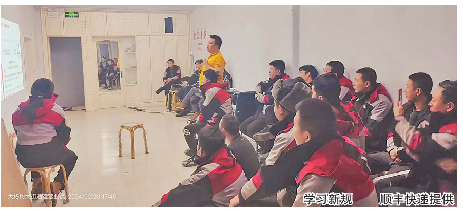
学习新规 顺丰快递提供

生活报讯(记者李威兵)从3月1日起,交通运输部发布的《快递市场管理办法》(以下简称《办法》)开始施行。新规较之前有一些变化,包括快递企业应公示服务地域、服务时限;保障快件安全,防止快件丢失、损毁、内件短少,不得抛扔、踩踏快件;未经用户同意擅自使用智能快件箱等方式投递将被处罚等。对于新规的实施,我省部分快递企业表示,将严格执行新规,提升服务质量,进一步做好快递运送工作。