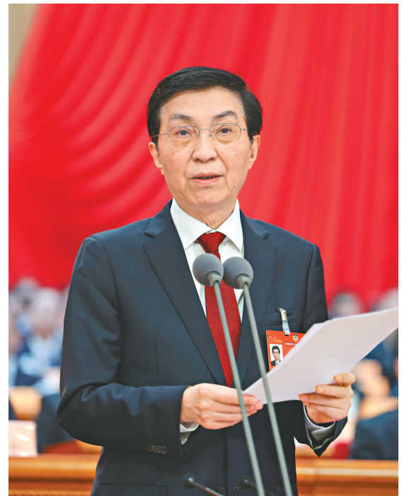
全国政协主席王沪宁主持闭幕会并讲话。