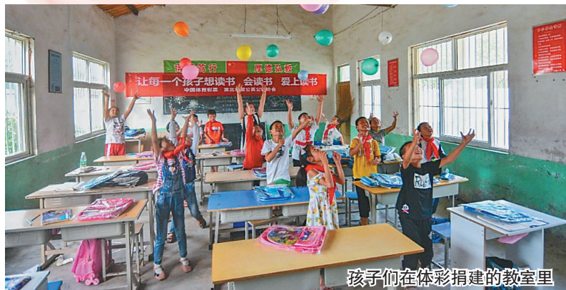
孩子们在体彩捐建的教室里