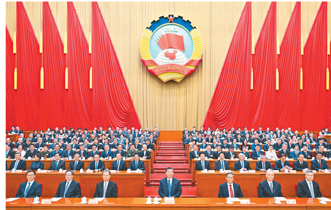
3月10日上午,中国人民政治协商会议第十四届全国委员会第二次会议在北京人民大会堂闭幕。这是习近平、李强、赵乐际、蔡奇、丁薛祥、李希、韩正在主席台就座。新华社记者 黄敬文 摄