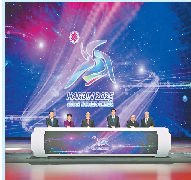
13日晚,哈尔滨2025年第九届亚洲冬季运动会倒计时300天主题活动在哈尔滨大剧院举行。许勤、高志丹、梁惠玲、霍震霆、于再清、于洪涛按下启动按钮,共同启动“亚冬会倒计时300天”。