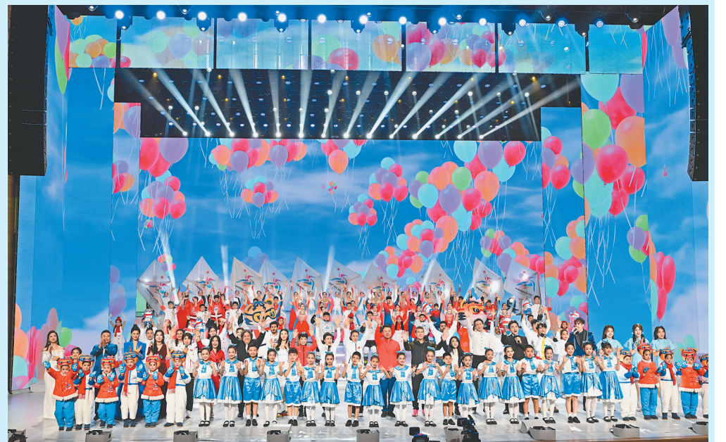
13日晚,哈尔滨2025年第九届亚洲冬季运动会倒计时300天主题活动在哈尔滨大剧院举行。图为演出现场。