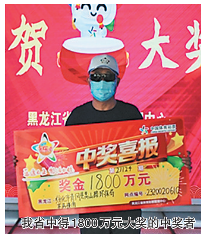
我省中得1800万元大奖的中奖者

此外,14场胜负彩二等奖开出255注,单注奖金50824元;任选九场开出490注30451元大奖。本期胜负彩销量为67501232元,任九投注总额为23314730元。