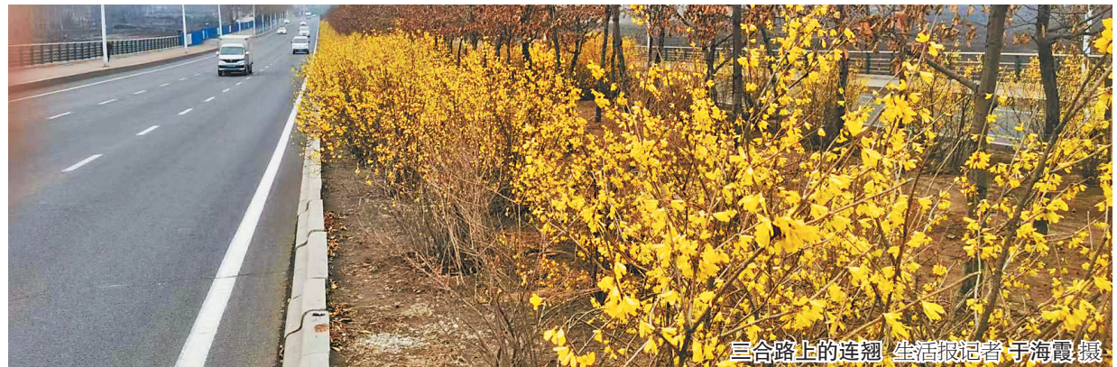
三合路上的连翘 生活报记者于海霞摄

生活报讯(记者李丹文/摄)15日,记者在哈市儿童公园、新阳路、学府路、三合路、松北大道、三环路(南岗、香坊区段)等区域看到,众多东北连翘已开花,一朵朵黄色的小花随风摇曳,吸引了众多市民驻足拍照打卡。东北连翘的绽放也代表着哈市的春花季节已开启,京桃、山杏、李树、梨树及市花丁香也将陆续粉墨登场。