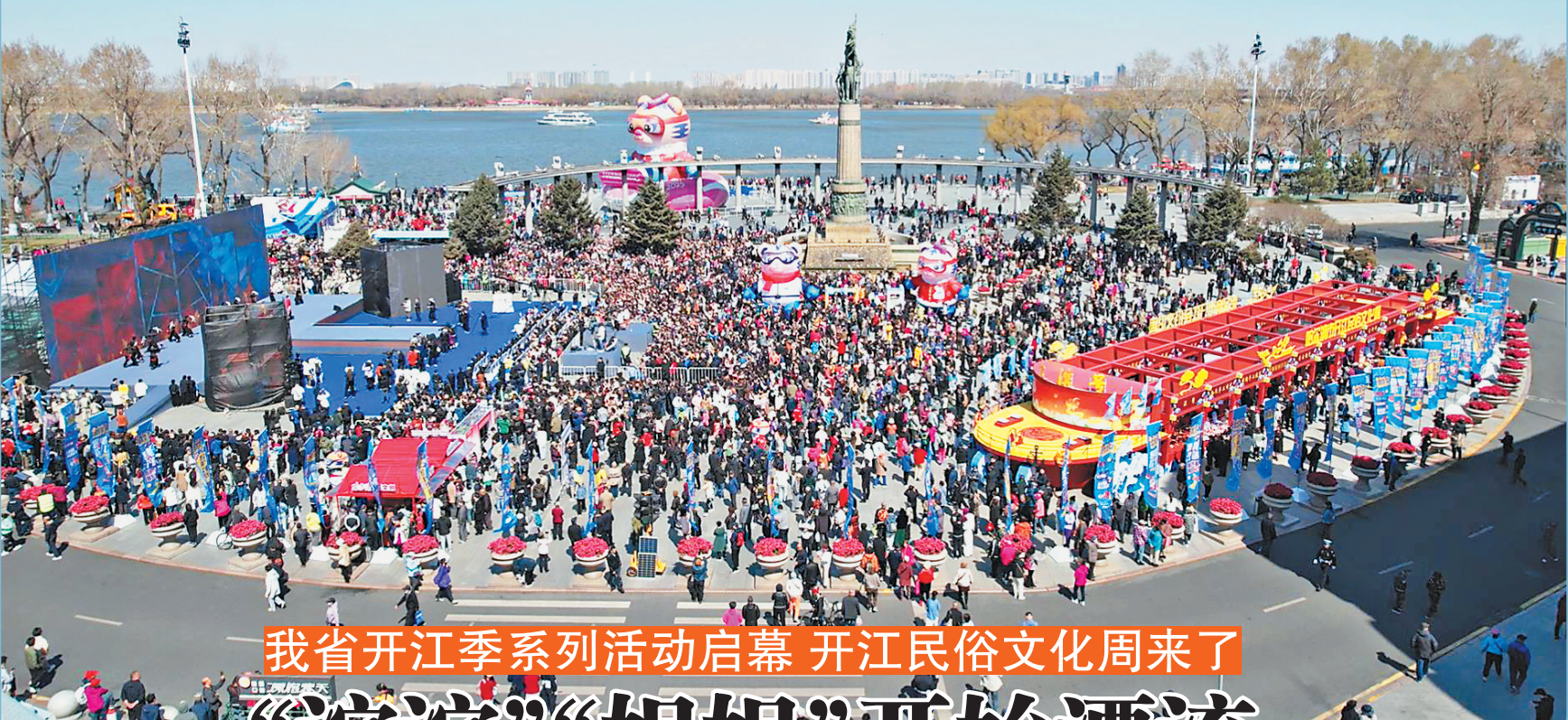
我省开江季系列活动启幕 开江民俗文化周来了