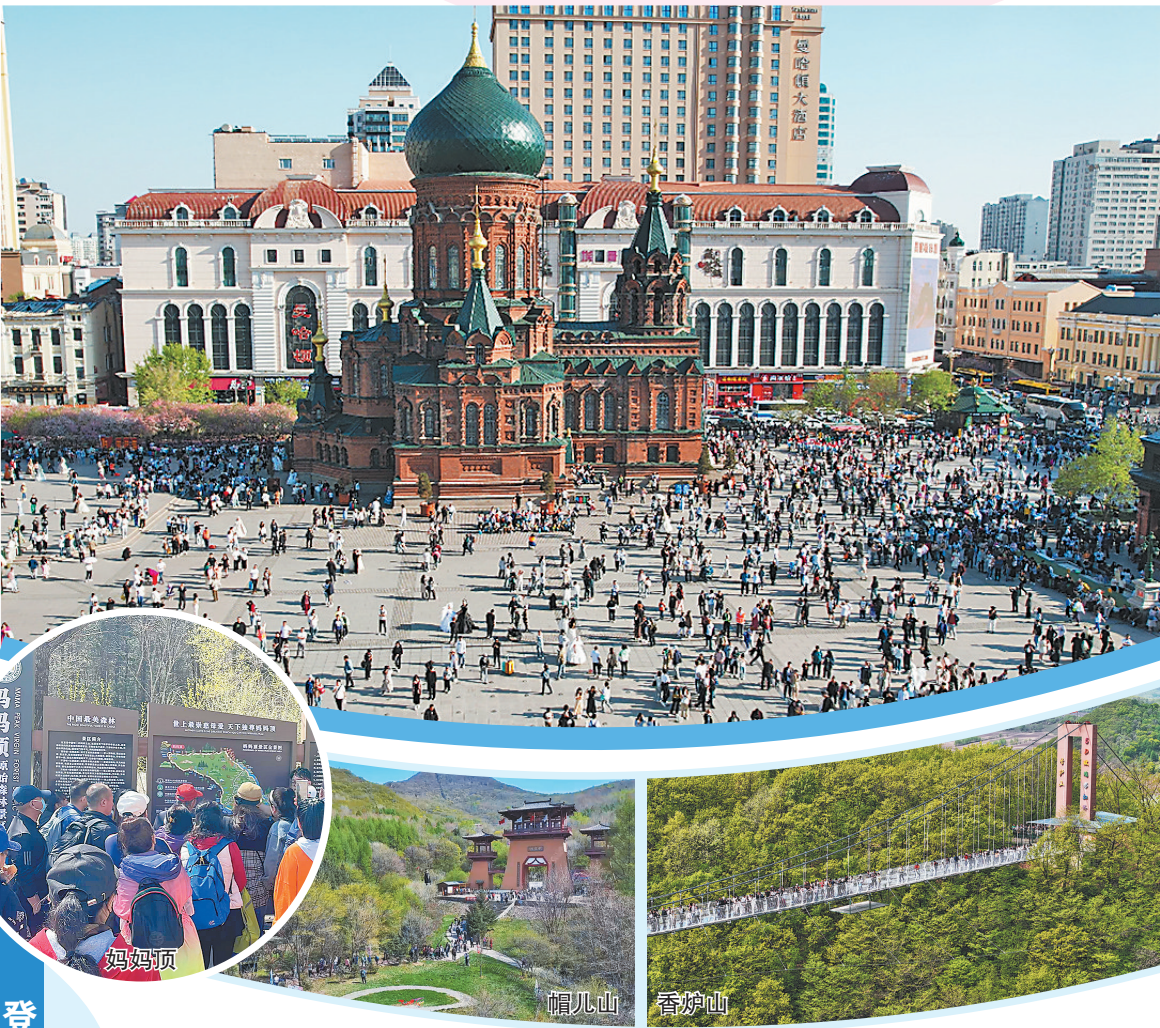
登山景区人气旺「野趣」十足