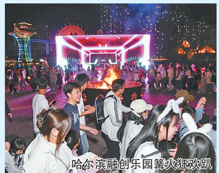
哈尔滨融创乐园篝火狂欢

热雪奇迹打造了“雪地花海露营节”,让滑雪爱好者及广大游客在滑雪的同时,还能体验北欧雪地帐篷、中式围炉煮茶、雪地livehouse、花海露营的乐趣。