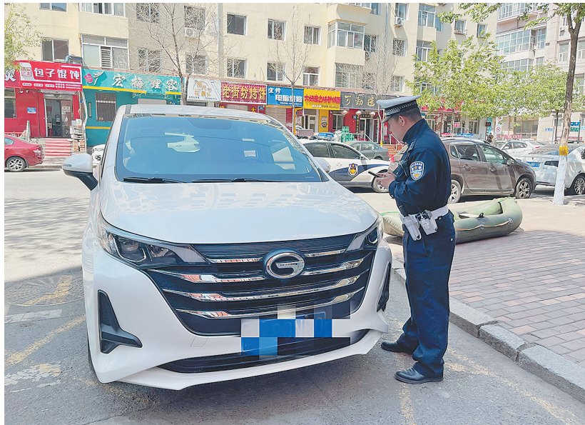
福街138-3号大院大门前,黑AE333*号车占用消防通道,民警立即联系该驾驶人,让其尽快驶离。在距离此处不到20米处,小区的另一消防通道门前,号牌为黑A7X8M*、黑A2C8F*的两台车将消防通道占满。民警联系上两辆车的驾驶人,劝其尽快驶离。以上车辆均因违法停车被处罚。

10时30分许,交警来到升永街45号某居民小区门前看到,此处是该小区居民进出的重要通道,地面上施划着黄色网格线,而黑A80NR*号车却随意停放在此处,居民进出需要绕行。交警立即致电驾驶人,劝其尽快挪开车辆,并对其进行教育。在延