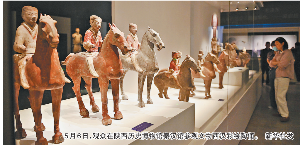
5月6日,观众在陕西历史博物馆秦汉馆参观文物西汉彩绘陶俑。

“博物馆热,与当下游客的精神文化需求增长密不可分。”天津博物馆党委书记于健表示,年轻人观展正逐渐从参观向参与转变,从游览向深入研学转变,对博物馆展览的广度、深度都提出了新的要求。“不仅如此,文博游品质化、个性化趋势越来越明显。游客对博物馆的体验、研学、娱乐需求不断提升。”