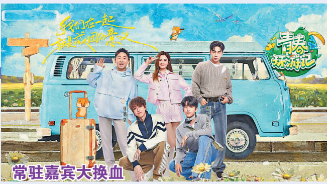
常驻嘉宾大换血 蔡卓妍、刘宪华加盟《青春环游记5》

时隔四年,以直播形式重启的《歌手2024》引发全网沸腾,“韩红请战”等话题接连登上热搜。10日晚,湖南卫视及芒果TV《歌手2024》首场竞演拉开序幕,美国女歌手Chanté Moore香缇·莫、二手玫瑰、杨丞琳、汪苏泷、海来阿木以及摩洛哥裔北非女歌手Paouzia凡希亚惊艳开唱。 直播、全开麦、不修音,国内歌手紧张的情绪与两位外国歌手松弛的状态形成鲜明对比。竞演结束后,两位外国歌手包揽前二,于是网友们纷纷喊话心中的实力唱将参加节目。随后,韩红微博发文:“我是中国歌手韩红,我请战。”腾格尔发文回应:“感谢大家的厚爱,我都看见了!”林志炫写道:“因为巡演撞期无法成行,深感遗憾。”此外,纪敏佳、江映蓉、曾一鸣、刘美麟、娄艺潇等也纷纷跟进报名。 14日,《歌手2024》官方微博官宣首轮揭榜歌手:“综合演唱能力、音乐作品、舞台风格、市场潜力、揭榜报名信息、微博反响等多个维度考量,专家顾问团决定推选杭盖乐队、黄宣为首轮揭榜歌手。”对此,网友们留言:“第二轮请把握好,感觉会有惊喜!”