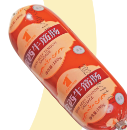
装备六:宾西牛筋肠(一根)