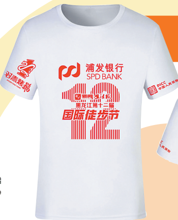
装备一:带有徒步节图标的T恤衫