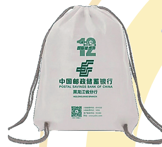
装备三:双肩抽绳包