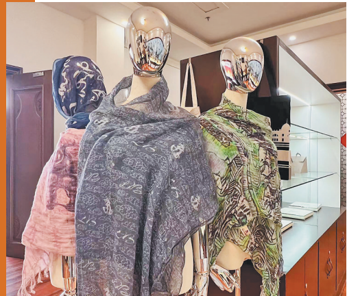
印有铜坐龙等元素的亚麻围巾